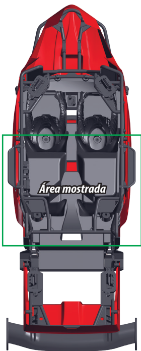
Diagrama de cableado de la carrocería